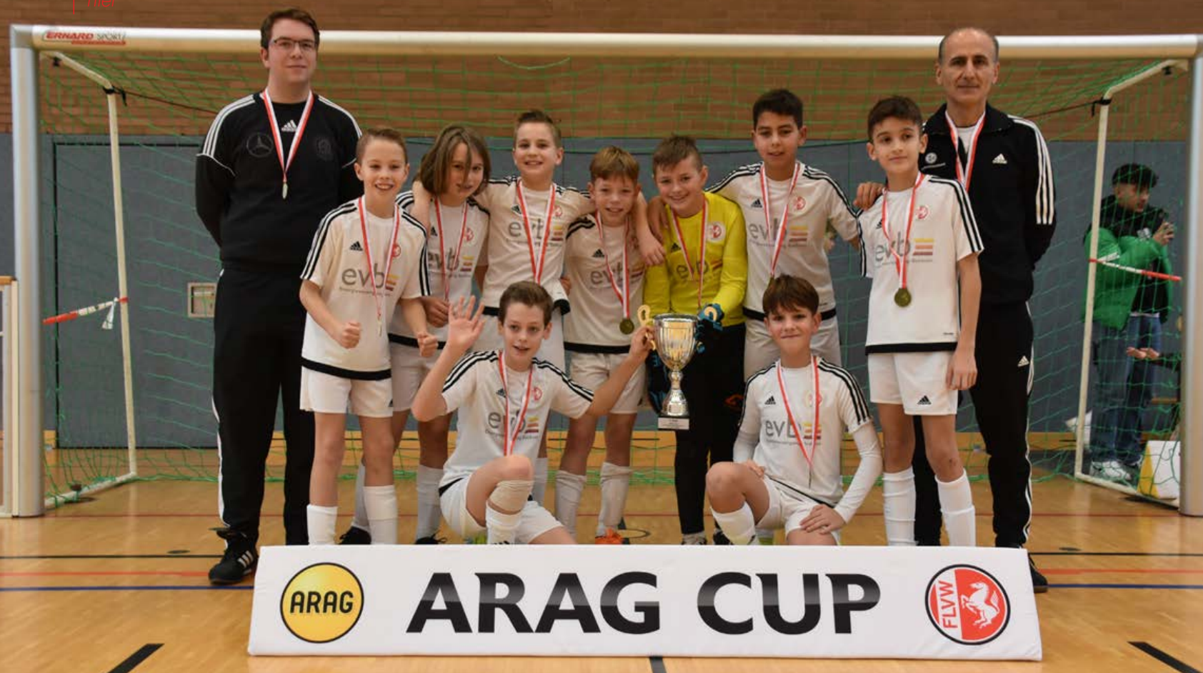
Souveräner Sieger der Quali-Runde beim ARAG Cup 2023: Der Stützpunkt Beckum