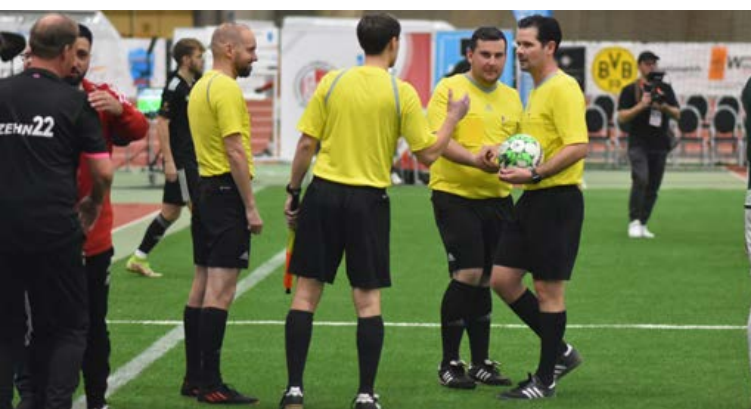
Ein Team – Nach jedem Spiel kommen die Schiedsrichter zusammen