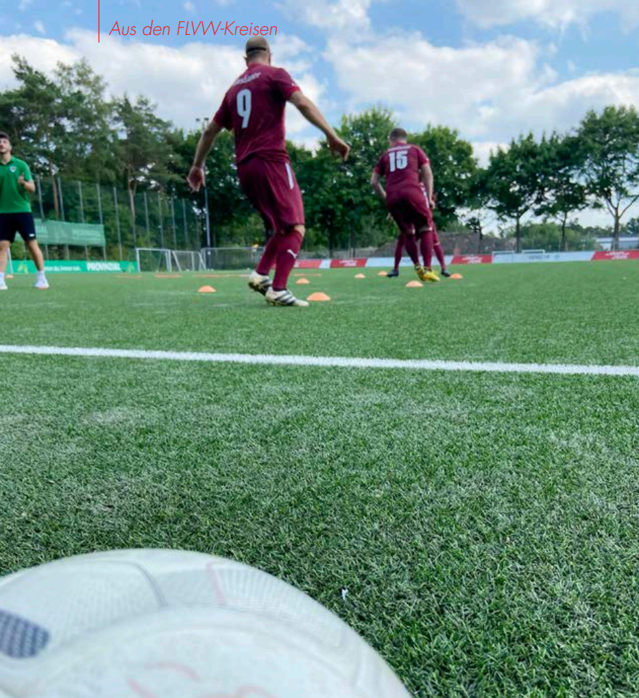
Einmal die Woche wird auf dem Kunstrasen der Preußen trainiert

A uf dem Rasen treten an diesem Tag die Alexianer gegen den Stadtrat an – die einen sind ein Inklusionsteam, die andere Mannschaft besteht als lokalen Politikern und anderen Vertretern der Verwaltung. 2:1 heißt es am Ende für die Mädchen und Jungs mit Handicap, Spaß an der Begegnung haben alle. „Der Stadtrat hat bereits angekündigt, dass er auf ein Revanchespiel besteht“, verrät Johannes Paus.