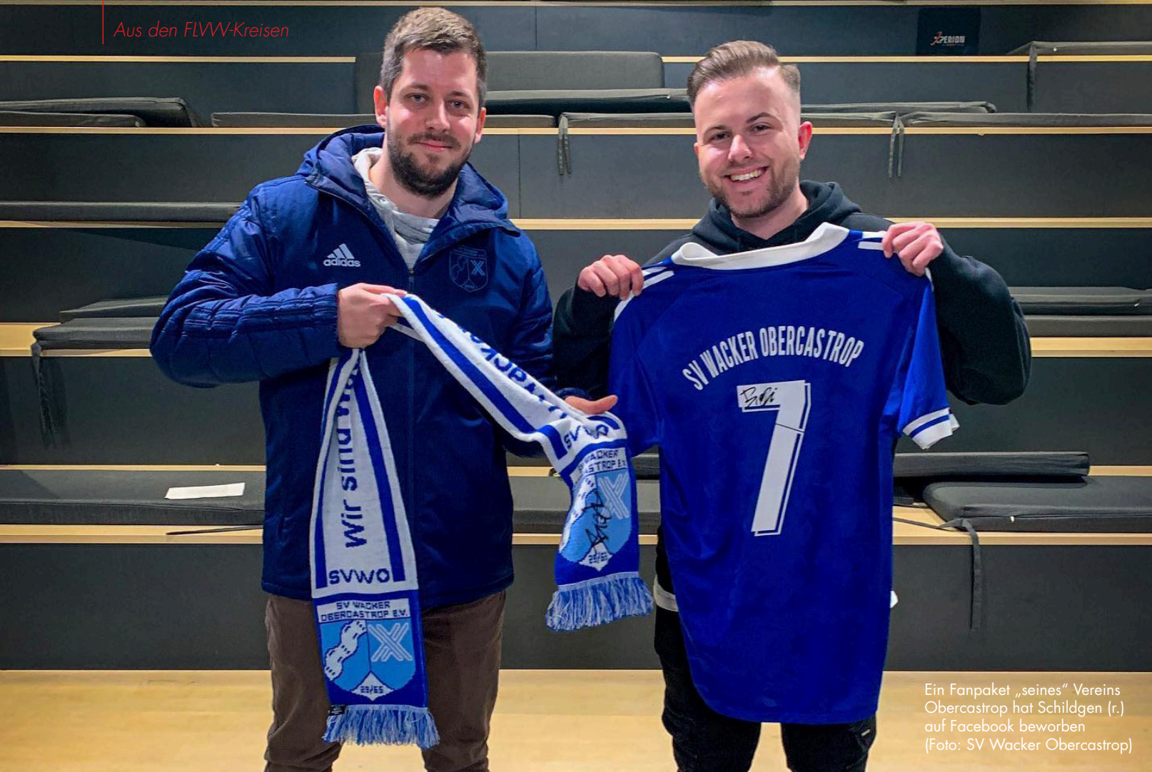
Ein Fanpaket „seines“ Vereins Obercastrop hat Schildgen (r.) auf Facebook beworben