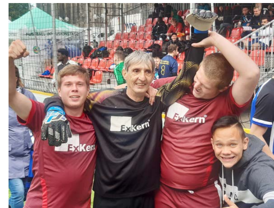
Und auch in diesem Jahr wollen die Inklusionskicker in Köln wieder jubeln