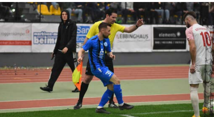
Als Schiedsrichter ist man in der Halle immer nah am Spielgeschehen