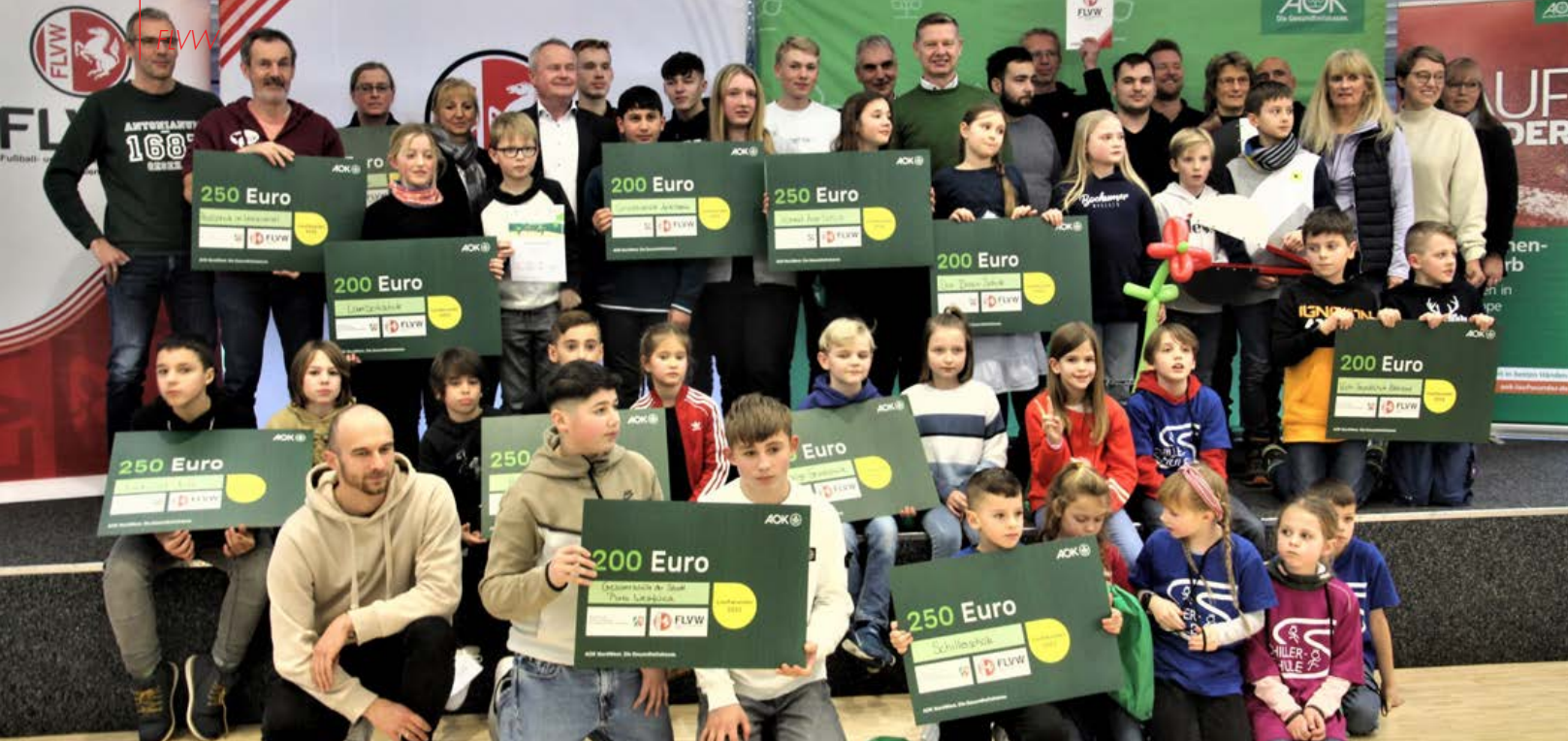
Groß war die Freude der Schüler*innen, als sie im SportCentrum Kaiserau Urkunden und Preise überreicht bekamen